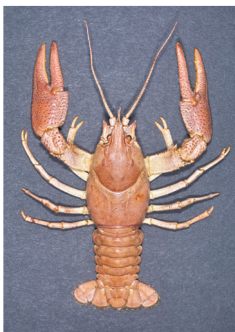
Edelkrebs Astacus astacus

Sehr geehrte Damen und Herren Liebe Freunde der Natur