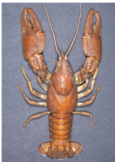
Dohlenkrebs Austropotamobius pallipes

Rolf Schatz • Sihltalstr. 60 • 8135 Langnau a/A • 079/ 413 29 46 • schatz@igfischerei.ch