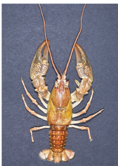
Steinkrebs Austropotamobius torrentium